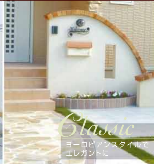
Classic ヨーロピアンスタイルで エレガントに