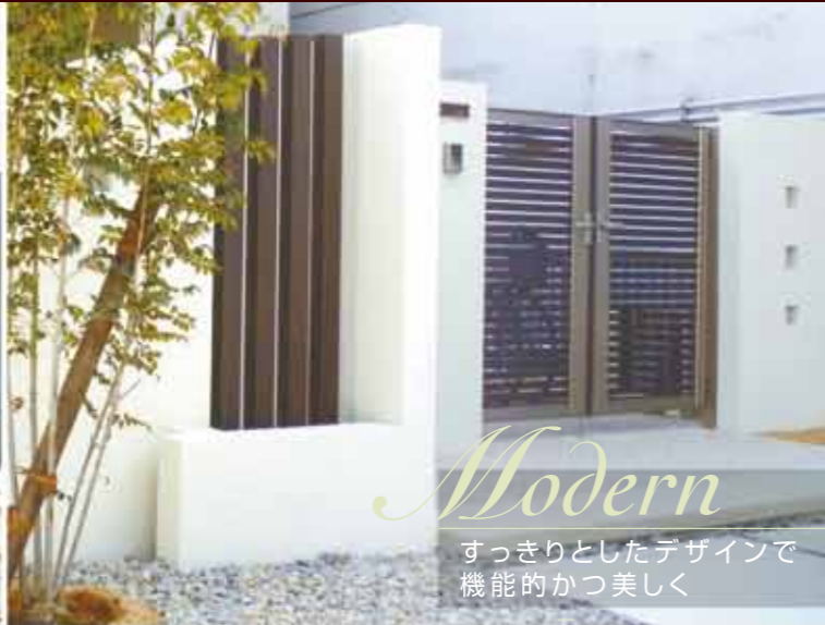
Modern すっきりとしたデザインで 機能的かつ美しく