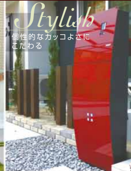
Stylish 個性的なカッコよさに こだわる