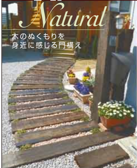
Natural 木のぬくもりを 身近に感じる門構え

ちょっとしたこだわりも、理想や想いも、まずはご相談ください。ライフ・ランドはご予算、ご要望に応じたお庭造りをご提案いたします。